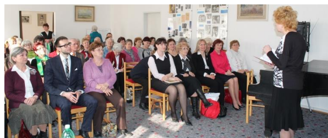
Krajská prehliadka umelec. prednesu seniorov na počesť Ľ. Štúra (11. 3.)