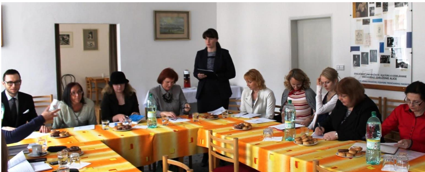
Komplexný rozbor činnosti verejných knižníc v zriaďovateľskej pôsobnosti TSK s regionálnou pôsobnosťou za rok 2014