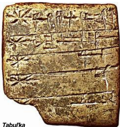
Tabuľka s menami sumerských bohov

V Egypte, ktorý netrpel nedostatkom kameňa, ale i v starovekej Číne sa ryli texty do kamenných tabuliek a perlete, v Číne aj do bambusových doštičiek a medených i iných kovových dosiek.