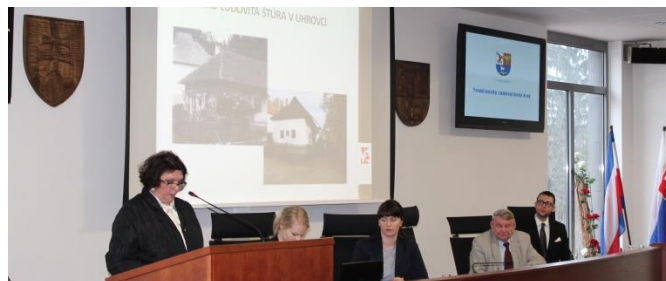
Seminár pri príležit. 200. výročia narodenia Ľ. Štúra na Úrade TSK (17. 6.)

Zdroj: MY Trenčianske noviny, č. 3/20125, s. 8