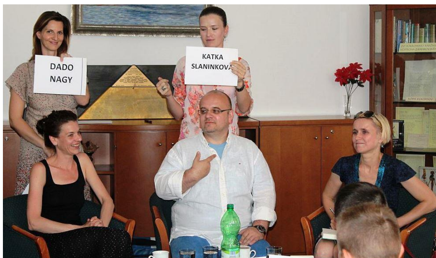
FAKTICKY FANTASTICKÁ BESEDA (11. 6. 2015)