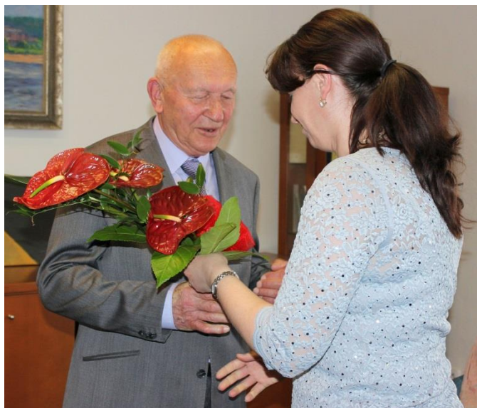
Počas besedy v trenčianskej knižnici (21. 4. 2015)